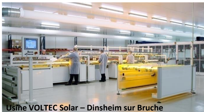
Usine VOLTEC Solar – Dinsheim sur Bruche

En choisissant les modules photovoltaïques fabriqués par VOLTEC Solar, les investisseurs bénéficient de la qualité française et contribuent au renforcement de l'économie nationale et européenne.